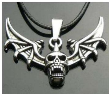
Черепа, летучие мыши, гробы