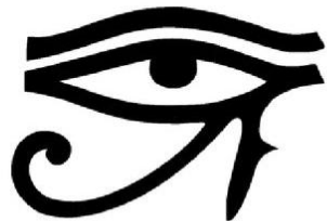
Глаз Ра – символ светил: правый – Солнце, левый - Луна