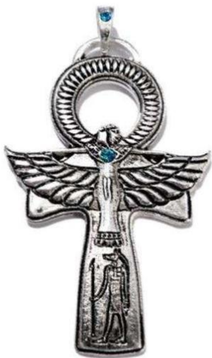
Анкх – символ возрождения